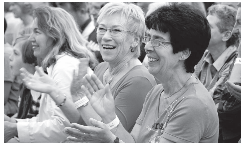
In Sigmaringen brauchte man für das Lachen keine Einladung – nur viel Spaß an Comedy aus Baden-Württemberg.