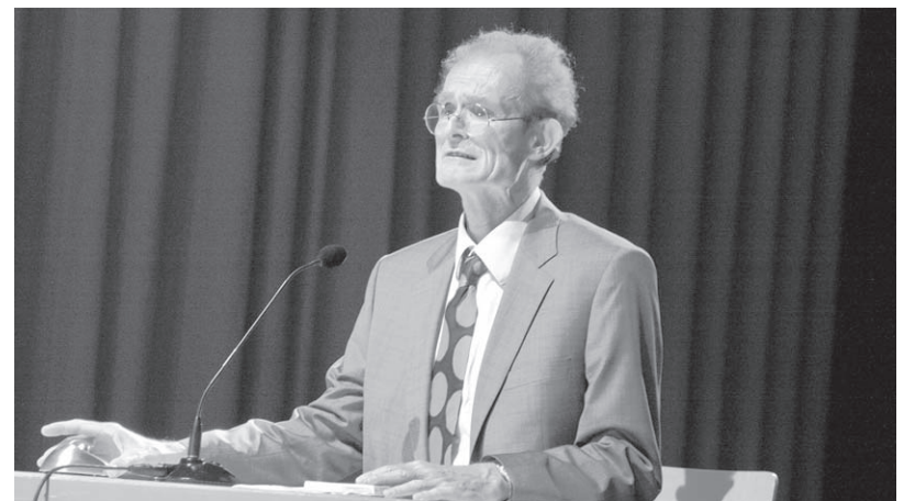
Er hat es geschafft: Offensichtlich haben in Sigmaringen einige Leute seine halbfertigen Schachtelsätze kapiert.

irgendwie anatolisch vorkommt. In Sigmaringen wird er fründig und das bei einem Publikum, das ihm auch die älteste „Türkenklamotte“ dankbar abnimmt, denn Büilent versteht es einfach wunderbar, die türkische Seele und Tradition mit seiner deutschen Denkweise und Wahrnehmung zu einer Symbiose aus Lachvirus und Realität werden zu lassen. Und dass er denn auch noch rappt, das macht den