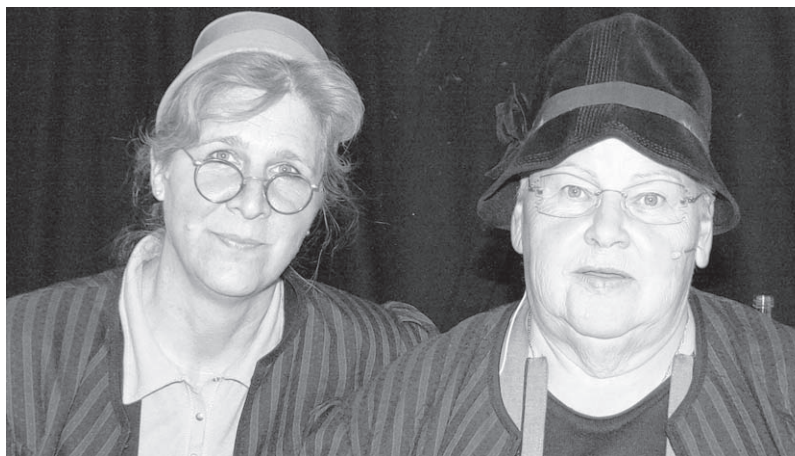
Wunderten sich über „Reigschmecke“ aus Pfullendorf: Die „Bronnweiler Weiber“ haben eine eigene Art von Humor.

sind ein bisschen schlauer hinterher und auch der 1,96 Meter große Rotblonde mit der Schuhgröße 48 fühlt sich in Sigmaringen wohl: „Sie machen so einen herzlichen Eindruck“.