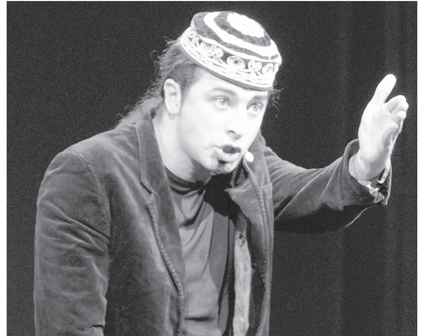
„Bist du Türke?“ Büilent Ceylan kommt aus Mannheim und nimmt Deutsche und Türken mächtig auf die Schippe.